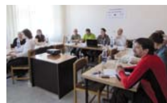
Stretnutie pracovnej skupiny k projektu.

Občianske združenie „Kopaničiarsky región - miestna akčná skupina“ podalo v spolupráci s MAS Horňácko a Ostrožsko 9. 8. 2010 Žiadosť o finančný príspevok na projekt vypracovaný KR-MAS s názvom „Načo chodiť pešky, keď môžu byť bežky...“ predložený v rámci výzvy Fondu mikroprojektov Operačného programu cezhraničnej spolupráce Slovenská republika - Česká republika 2007-2013.