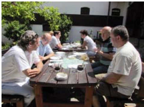
Diskusia s režisérom Filmu o kopaničiarskom regióne.

K tomu, aby film mal slušnú úroveň, je nevyhnutné vytvorenie pracovnej skupiny, ktorá sa bude pravidelne stretávať a diskutovať o podobe a spracovaní filmu a následne jeho tvorbu koordinovať a pripomienkovať,“ povedal režisér filmu. Zároveň vyzval zúčastnených, aby svoje nápady a podnety, ktoré by mal film obsahovať, dali