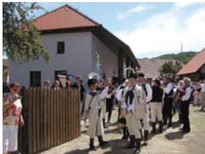
Gazdovský dvor v Turej Lúke.

- predstaví sa tradičný spôsob zberu obilia a jeho spôsob následného spracovania s využitím ovocia na ochutnávky tradičnej gastronómie. 10 výrobcov sa predstaví v štýlových stánkoch s ochutnávkami či predvádzaním výrob na akcii.