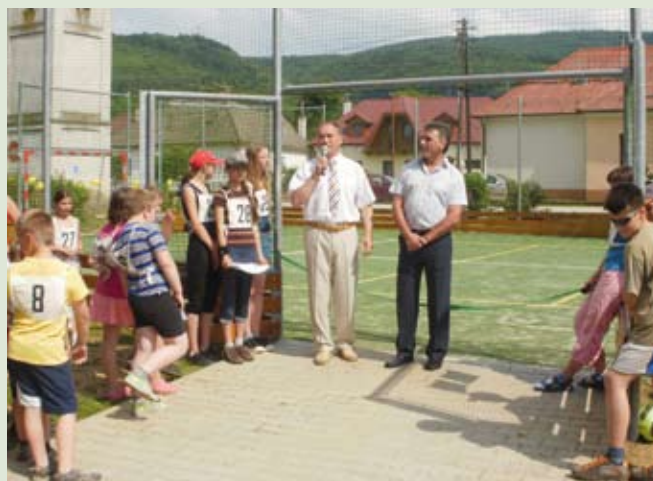
Slávnostné otvorenie viacúčelového ihriska v Bzincach pod Javorinou.

Nedávno bol tiež ukončený projekt „ Výstavba viacúčelového ihriska s detskými prvkami v obci Bzince pod Javorinou “, kde bolo ihrisko v osade Hrušové dňa 05. 06. 2011 slávnostne otvorené a dané do užívania verejnosti. Celkovo obec preinvestovala na projekte 55 656,01 EUR, kde výška finančného príspevku z PRV SR 2007 – 2013 bola 54 036,01 EUR.