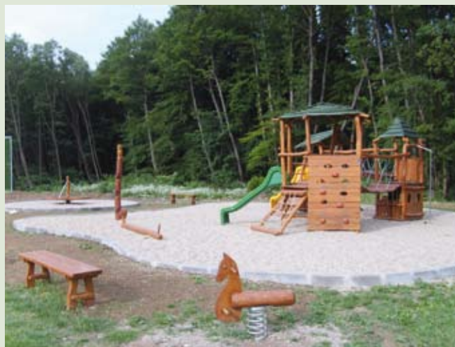
Viacúčelové ihrisko v Starej Myjave.

Stavebné práce na projekte „ Výstavba viacúčelového a detského ihriska v obci Stará Myjava “ skončili koncom mája. Náklady na realizáciu tohto projektu sa vyšplhali na 66 365,15 EUR. Výška finančného príspevku po predložení záverečnej žiadosti o platbu bude spolu 62 000,00 EUR.