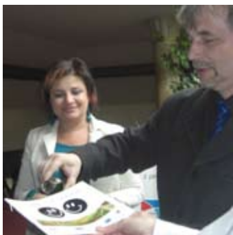
Krst spoločnej brožúry.

Poslednou aktivitou vzájomnej spolupráce bolo vydanie propagačného materiálu - brožúry projektu, ktorú spracovala partnerská MAS Boskovicko PLUS